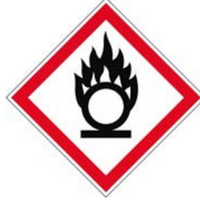
(Kırmızı kenarlı beyaz arka planda siyah simge)