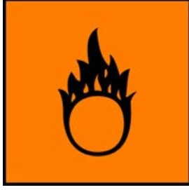
(Turuncu arka planda siyah simge)

Bir maddenin ambalajında aşağıdaki piktogramlardan biri var. Bu maddenin özelliklerinden biri nedir?